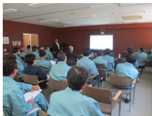
2021年11月20日 事故防止研修会