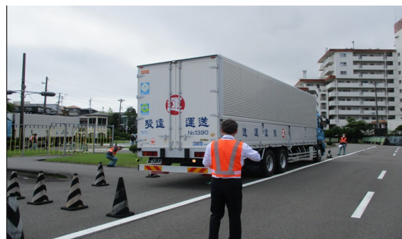
2022年7月17日 ドライバーズコンテスト