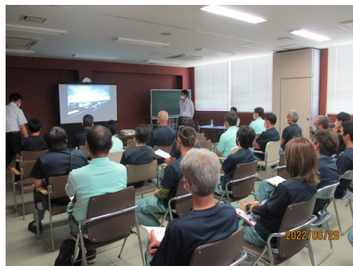
2022年6月28日 事故防止研修会