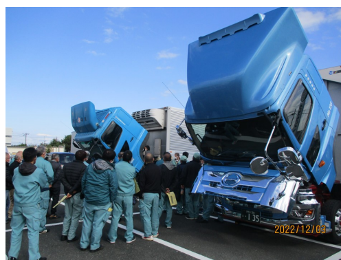
2022年12月3日 整備研修会