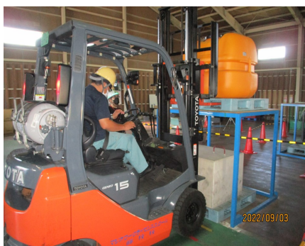
2022年9月3日 リフトコンテスト